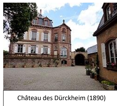
Château des Dürckheim (1890)

Pour ceux qui ont des oreillettes d'une sortie précédente, merci de les apporter.