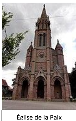
Église de la Paix

Vous connaissez certainement Frœschwiller par son château, la triste célèbre bataille du 6 août 1870. Mais savez-vous que le 22 décembre 1793, les troupes républicaines du Général Hoche ont battues celles du Général autrichien Wurmser, repoussant ainsi l'armée autrichienne hors des frontières de la République.