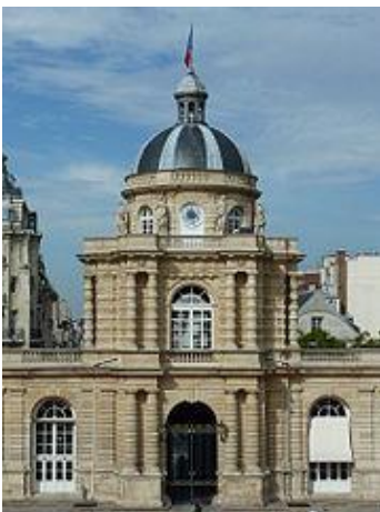
Lanterne du palais du Luxembourg