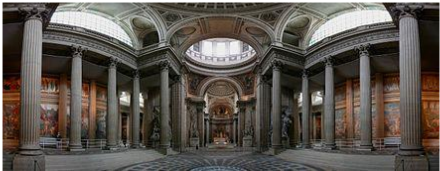
Intérieur du Panthéon