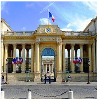
Cour intérieure du palais Bourbon

Contact : Monique Bahl, moniquebahl@gmail.com, tel : 06 78 67 89 63 Richard Weibel, richard.weibel@wanadoo.fr, tél : 03 88 73 36 69 ou 06 08 17 09 41