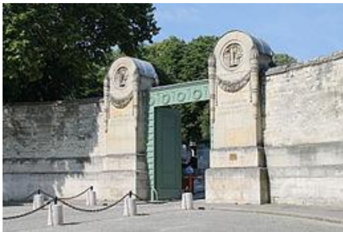
Entrée du cimetière du Père Lachaise