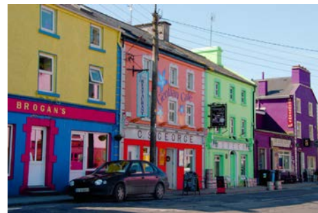
Ville de Dingle