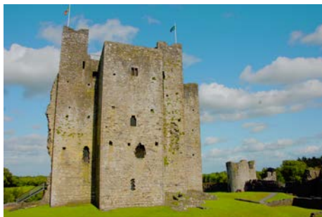
Château de Trimm