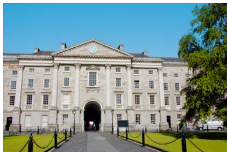
Trinity College à Dublin

Du 05 au 12 Juin, 44 membres de la SHAH ont passé une semaine en Irlande pour découvrir et comprendre l'histoire, la culture, l'économie, les us et coutumes de ce beau pays. Ce fut pour tous une semaine très chargée qui a été une remarquable opportunité de belles rencontres, de visiter un pays aux paysages variés et riches et d'appréhender une culture ancienne et fortement ancrée dans la vie de chaque citoyen irlandais. Nos voyageurs sont revenus ravis, enthousiastes avec plein de belles images et souvenirs.